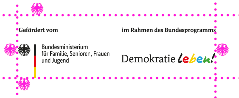
Illustration: Schutzraum um das Logo